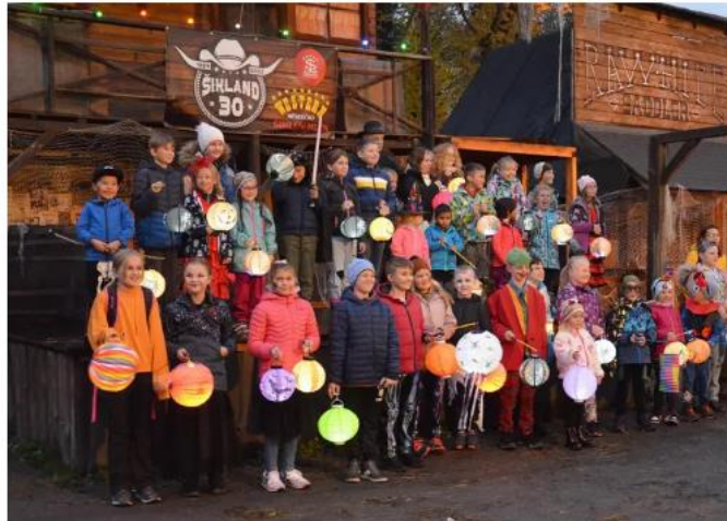
V zábavním parku Šikland nebude chybět strašidelná stezka

Přijďte si užít halloweenské oslavy do zábavního parku Šikland ve Zvoli nad Pernštejnem . V sobotu 26. a neděli 27. října se tu můžete těšit na různé tematické atrakce i bohatý animační program pro děti každého věku. Celý park bude stylově vyzdoben v duchu Halloweenu, probíhat bude westernová pouť, v místní restauraci ochutnáte rozmanité dýňové speciality. Děti se mohou zblízka seznámit se zvířaty (koňmi, lamami, pštrosy nebo dikobrazy), projít si zábavnou i strašidelnou stezku nebo se kreativně vyřádit ve tvořivé dílničce.